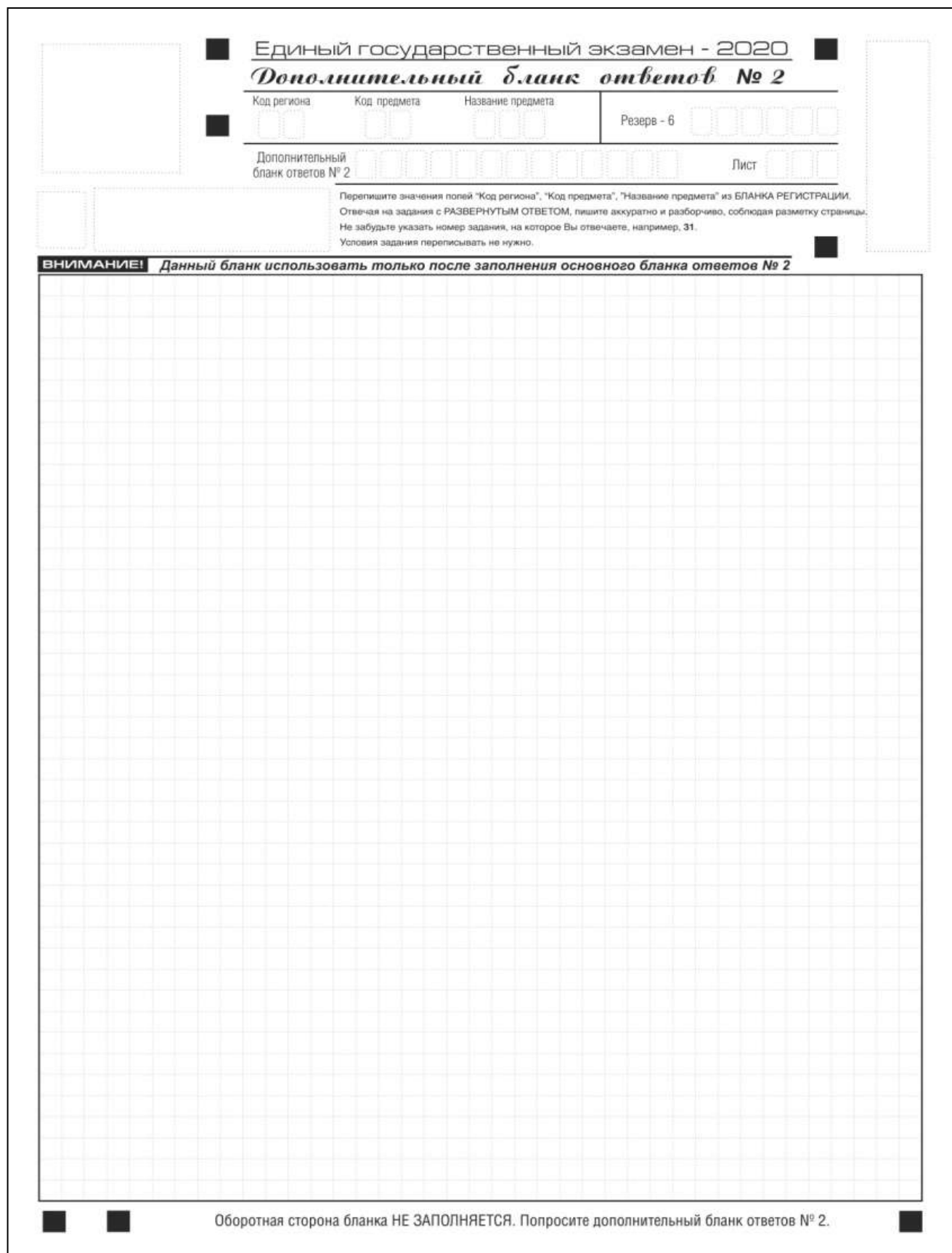
Рис. 15. Дополнительный бланк ответов № 2