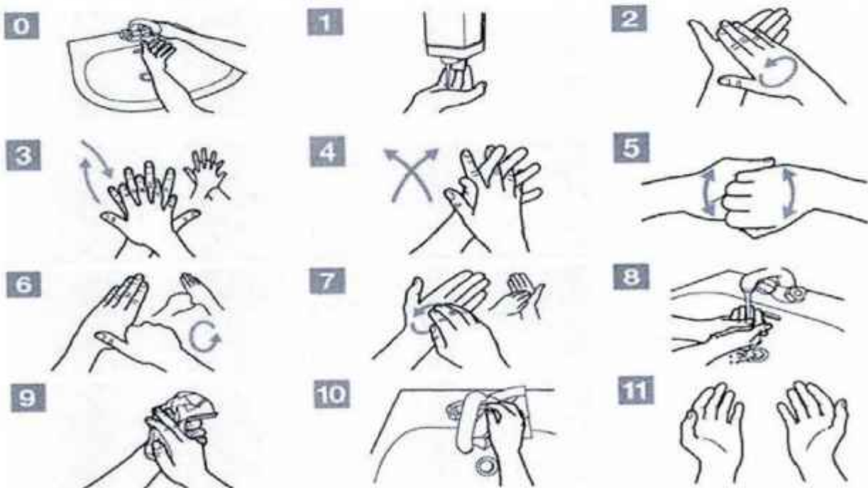
Рис. 11 – Процедура закончена

Рис.10 - Использовать полотенце для закрытия крана